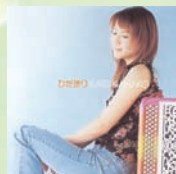
『ひだまり』 STBR-3002 2,800円(税込)