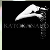
『独奏』 TAKI-6002 1,500円(税込)