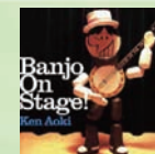
『Banjo On Stage!』 APCD-2014 2,835円(税込)