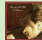
『うさぎのラビット』 2,000円(税込)