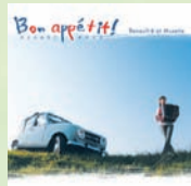
『ボナベチ』 TAKI-6001 2,000円(税込)