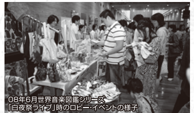
08年6月世界音楽図鑑シリーズ 「白夜祭ライブ」時のロビーイベントの様子