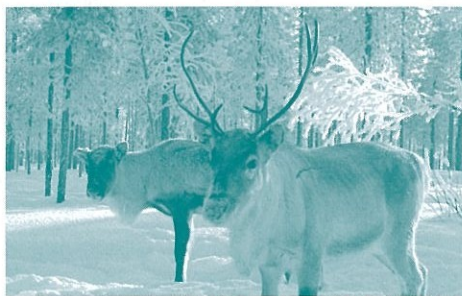
冬のラップランドに生きるトナカイ